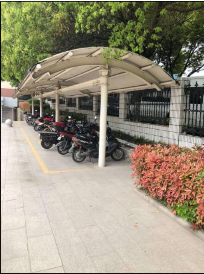
自行车车棚现状图